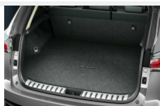
Wykładzina bagażnika tekstylna Dywaniki / Wykładziny