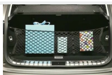
Siatka bagażnika pionowa Bagaż