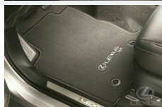
Dywaniki tekstylne Dywaniki / Wykładziny