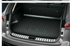
Wykładzina bagażnika gumowa Dywaniki / Wykładziny