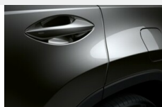
Folia ochronna klamek drzwi Nadwozie