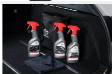
Zestaw kosmetyków samochodowych Toyota Kosmetyki